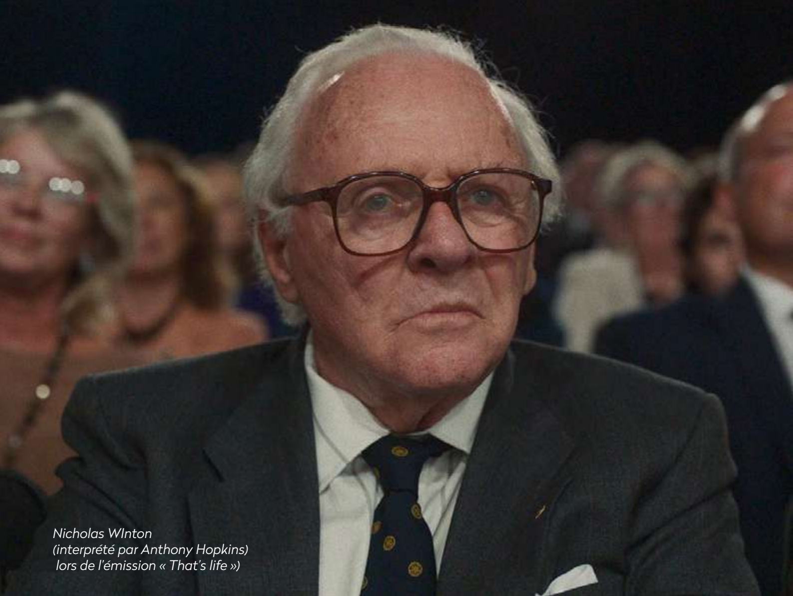
Nicholas Winton (interprété par Anthony Hopkins) lors de l'émission « That's life »