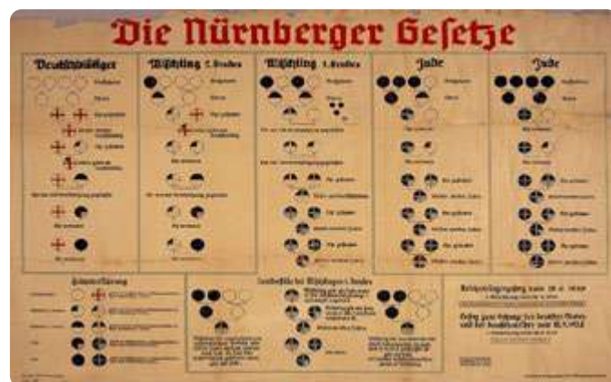
Tableau racial des lois de Nuremberg de 1935.

à des Juifs sont pillées et saccagées. Près de 30 000 Juifs sont arrêtés et envoyés dans des camps de concentration.