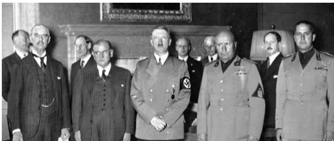
Chamberlain, Daladier, Hitler et Mussolini (avec à sa gauche son ministre Ciano), le 29 septembre 1938 à Munich